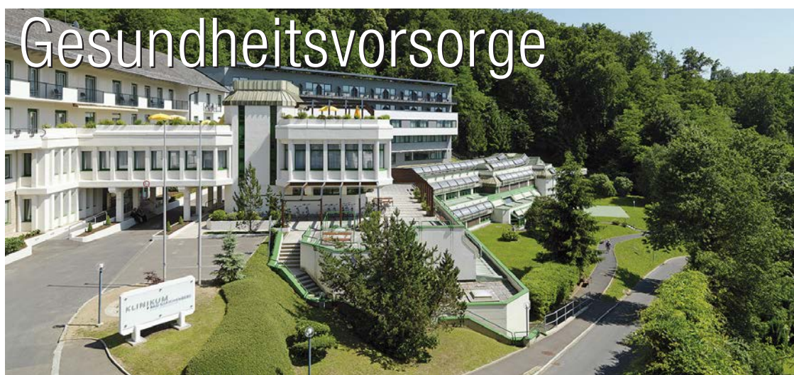
Klinikum in Bad Gleichenberg

Als Maßnahmen der Gesundheitsvorsorge können die Pensionsversicherungsträger Aufenthalte in Kurorten und Kuranstalten bzw. Zuschüsse zu solchen gewähren. Weiters kommt auch die Unterbringung in Krankenanstalten, die vorwiegend der Rehabilitation dienen, in Betracht. Die Pensionsversicherungsträger führen für diese Zwecke auch eigene Einrichtungen.