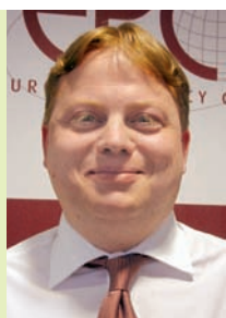
Dr. Fabian Zuleeg ist Chefökonom des European Policy Centre in Brüssel.

Verschiedene Studien, die sich mit Well-being befassen, zeigen, dass dieses neben der zentralen Rolle von Einkommen und finanzieller Sicherheit zu einem großen Teil auch von Bereichen abhängt, in denen staatliche Dienstleistungen von herausragender Bedeutung sind, wie zum Beispiel Gesundheit und Bildung. Daher erscheint eine Reform der Sozialpolitik über bloße Kürzungen hinaus notwendig, um ein Europa zu schaffen, das tatsächlich dem Wohlergehen seiner Bürger verpflichtet ist. Die Einflussgrößen auf dieses Well-being zu verstehen, kann dabei nur der erste Schritt zu einer umfassenden und