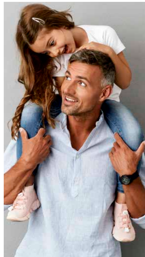
ELTERN sind die wichtigsten Bezugspersonen.