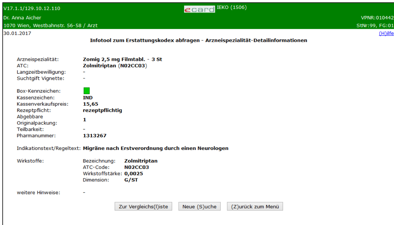
Abbildung 8: Detailansicht – Maske 1506

Durch Anklicken einer bestimmten Arzneispezialität haben Sie die Möglichkeit, sich über Einzelheiten dieses Medikaments zu informieren. In einer Übersicht werden Ihnen alle Detailinformationen zur ausgewählten Arzneispezialität angezeigt.