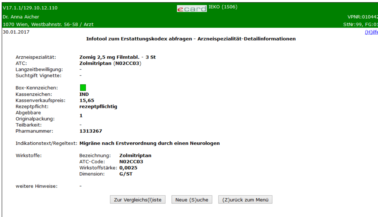
Abbildung 8: Detailansicht – Maske 1506

Durch Anklicken einer bestimmten Arzneispezialität haben Sie die Möglichkeit, sich über Einzelheiten dieses Medikaments zu informieren. In einer Übersicht werden Ihnen alle Detailinformationen zur ausgewählten Arzneispezialität angezeigt.