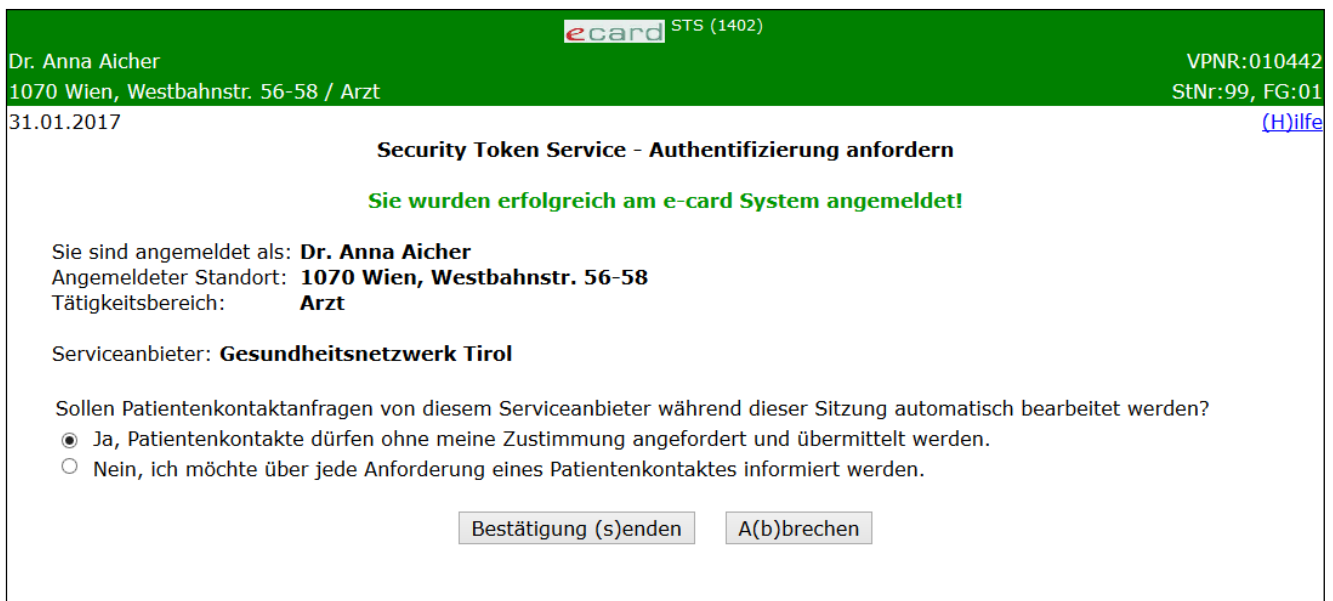
Abbildung 3: Anmelden erfolgreich - Maske 1402

In einer Zusammenfassung werden Ihre Anmeldedaten und die Bezeichnung des Serviceanbieters angezeigt.