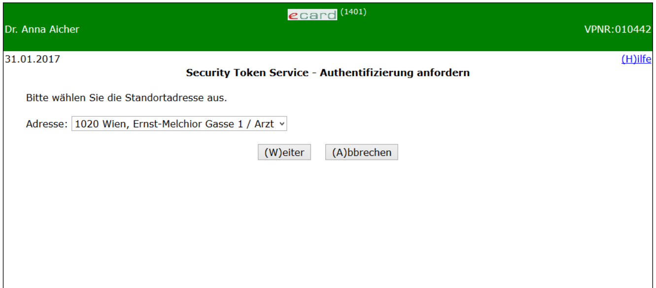
Abbildung 2: Auswahl der Adresse/Tätigkeitsbereich - Maske 1401

Haben Sie nur eine Standortadresse und einen Tätigkeitsbereich wird diese Auswahlaufforderung übersprungen (siehe → Kapitel Anmelden am System erfolgreich ).