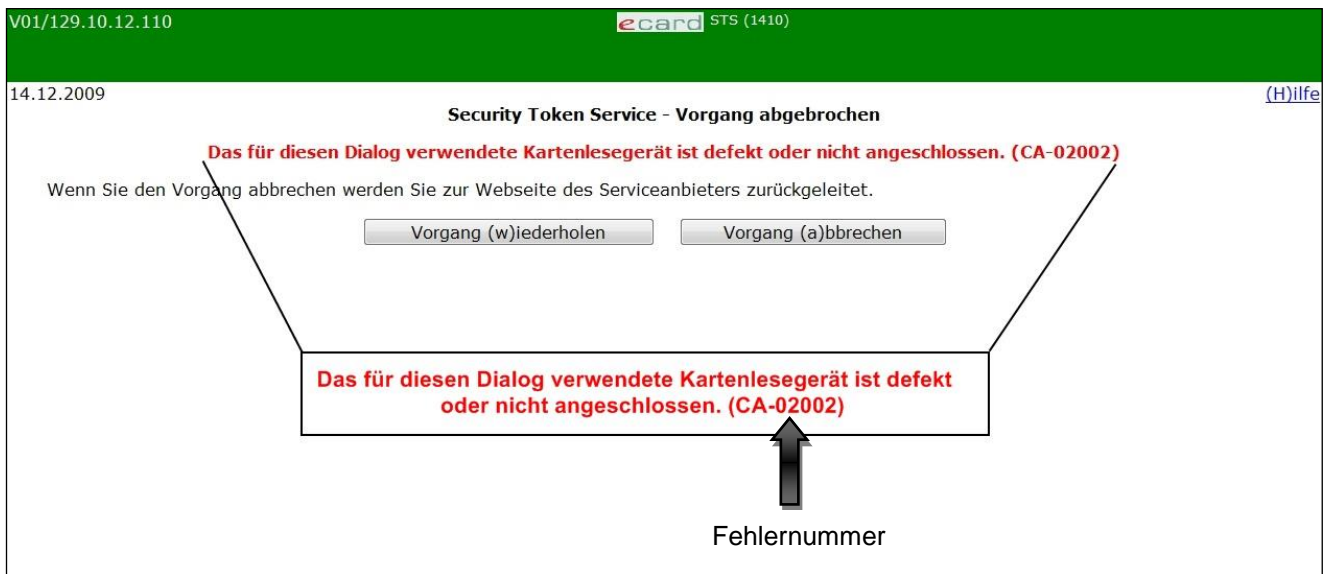
Abbildung 7: STS Fehlermeldung

Im Falle einer Fehlermeldung, deren Bedeutung nicht klar ist, notieren Sie sich bitte die Fehlernummer (z.B. CA-02002) und wenden Sie sich an den Serviceanbieter bzw. an die Serviceline.