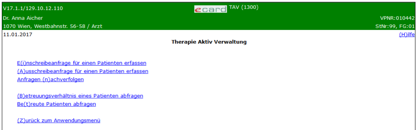
Abbildung 2: Therapie Aktiv Verwaltung – Maske 1300

Nachdem Sie den Menüpunkt [Therapie Aktiv Verwaltung starten] gewählt haben, kommen Sie zu diesem Dialog: