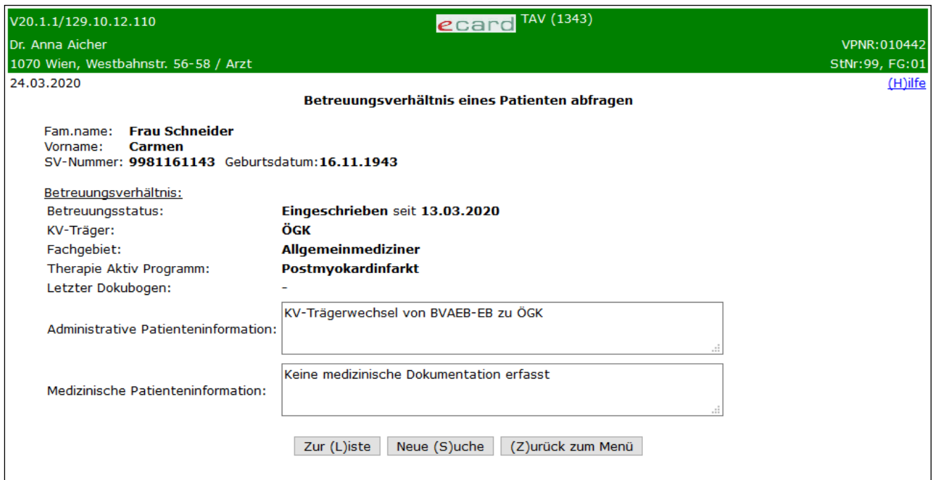
Abbildung 18: Betreuungsverhältnis - Detailansicht – Patient ist eingeschrieben – Maske 1343

Das aktuelle Ergebnis des Betreuungsverhältnisses wird Ihnen in einer Zusammenfassung angezeigt.