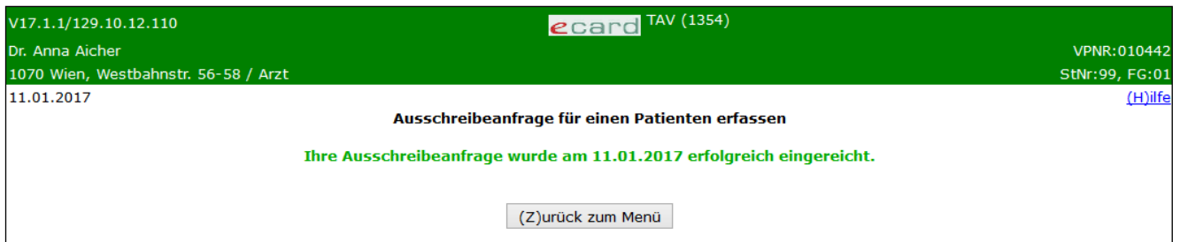
Abbildung 9: Erfassen der Ausschreibebeanfrage erfolgreich – Maske 1354

Es wird Ihnen die erfolgreiche Einreichung Ihrer Ausschreibebeanfrage angezeigt.