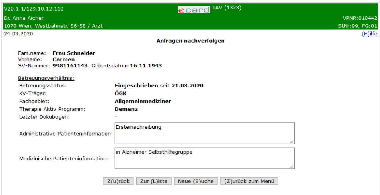
Abbildung 14: Betreuungsverhältnis – Detailansicht – Maske 1323

Der aktuelle Stand des Betreuungsverhältnisses wird Ihnen angezeigt.