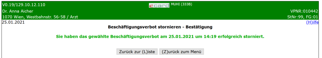
Abbildung 13: Beschäftigungsverbot stornieren - Bestätigung - Maske 333B

Auf der Bestätigungsmaske haben Sie die Wahl über [Zurück zur Liste] zur Liste der Suchergebnisse oder über [Zurück zum Menü] zum Mutterschaftshilfe Hauptmenü zurückzukehren.