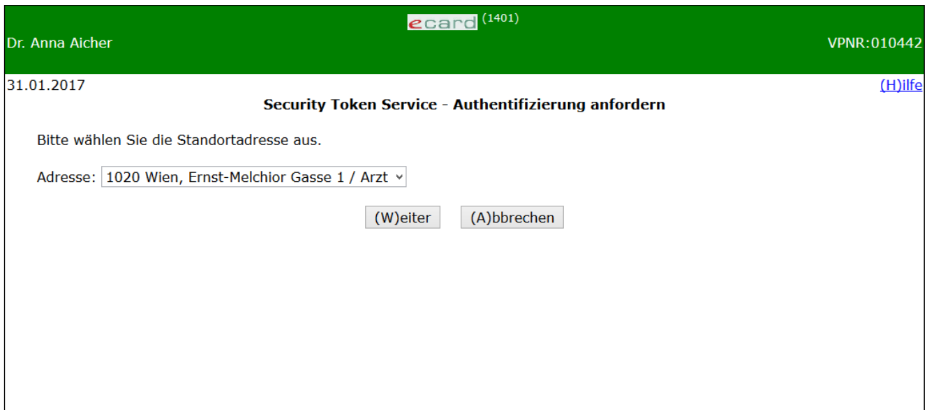
Abbildung 2: Auswahl der Adresse/Tätigkeitsbereich - Maske 1401

Haben Sie nur eine Standortadresse und einen Tätigkeitsbereich wird diese Auswahlaufforderung übersprungen (siehe → Kapitel Anmelden am System erfolgreich ).