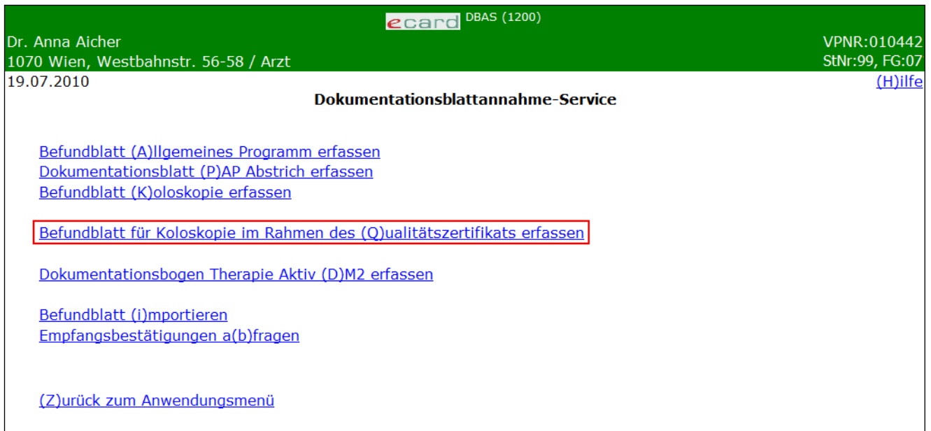
Abbildung 37: Menüeintrag wählen – Maske 1200

Wählen Sie [Befundblatt für Koloskopie im Rahmen des Qualitätszertifikats erfassen] für die Erfassung der Daten der Koloskopie-Untersuchung.