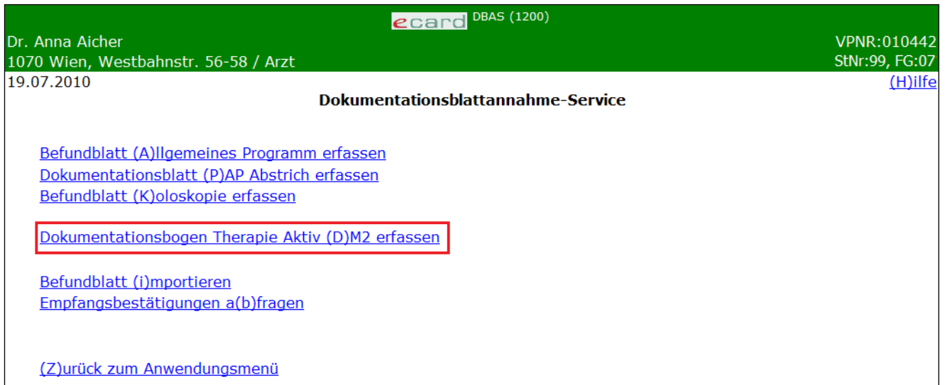
Abbildung 45: Menüeintrag wählen – Maske 1200

Wählen Sie [Dokumentationsbogen Therapie Aktiv DM2 erfassen] für die Ersterfassung sowie die Folgedokumentation der Patientendaten.