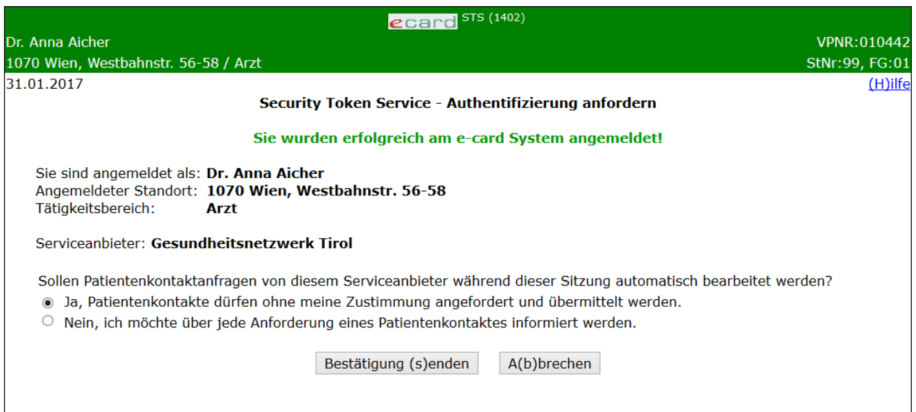
Abbildung 3: Anmelden erfolgreich - Maske 1402

In einer Zusammenfassung werden Ihre Anmeldedaten und die Bezeichnung des Serviceanbieters angezeigt.