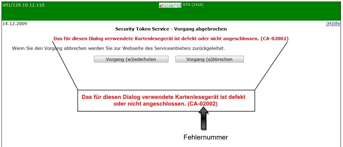
Abbildung 7: STS Fehlermeldung

Wenn Ihnen die Bedeutung einer Fehlermeldung nicht klar ist, notieren Sie sich bitte die Fehlernummer (z.B. CA-02002) und wenden Sie sich an den Serviceanbieter bzw. an die e-card Serviceline.