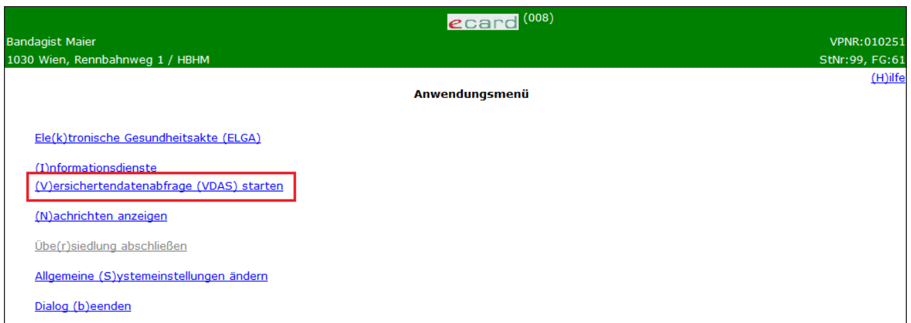
Abbildung 2: Menüeintrag wählen - Maske 008

Wählen Sie im Anwendungsmenü den Menüpunkt [Versichertendatenabfrage (VDAS) starten] , um das Service aufzurufen.