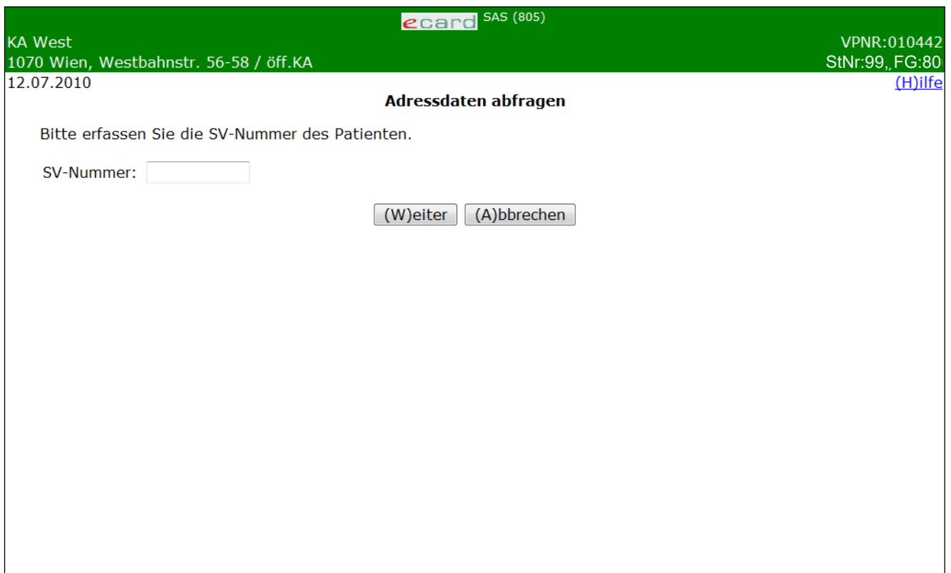
Abbildung 16: Patientendaten abfragen – Maske 805

Mit Hilfe der Sozialversicherungsnummer Ihres Patienten können Sie dessen Anschrift abfragen und überprüfen sofern Sie über die dazu notwendige Berechtigung verfügen (nur für Krankenanstalten).