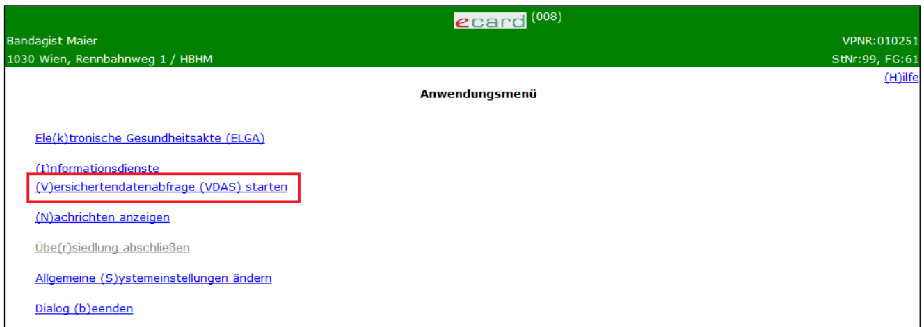
Abbildung 1: Anwendungsmenü - Maske 008

Nach erfolgreicher Anmeldung am e-card System (→ siehe Handbuch Allgemeiner Teil Kapitel Anwendung starten ) erscheint auf Ihrem Bildschirm die Maske des Anwendungsmenüs: