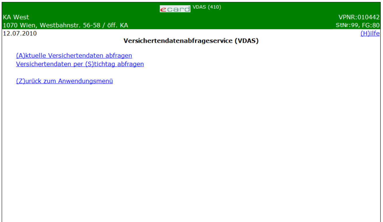
Abbildung 3: Versichertendatenabfrageservice – Maske 410

Diese Maske wird nur angezeigt, wenn Sie die Berechtigung zur Nutzung von VDAS als Krankenanstalt und Transportunternehmen besitzen. Bei Nutzung als Gesundheitsdiensteanbieter steht Ihnen nur die aktuelle Versichertendatenabfrage zur Verfügung.